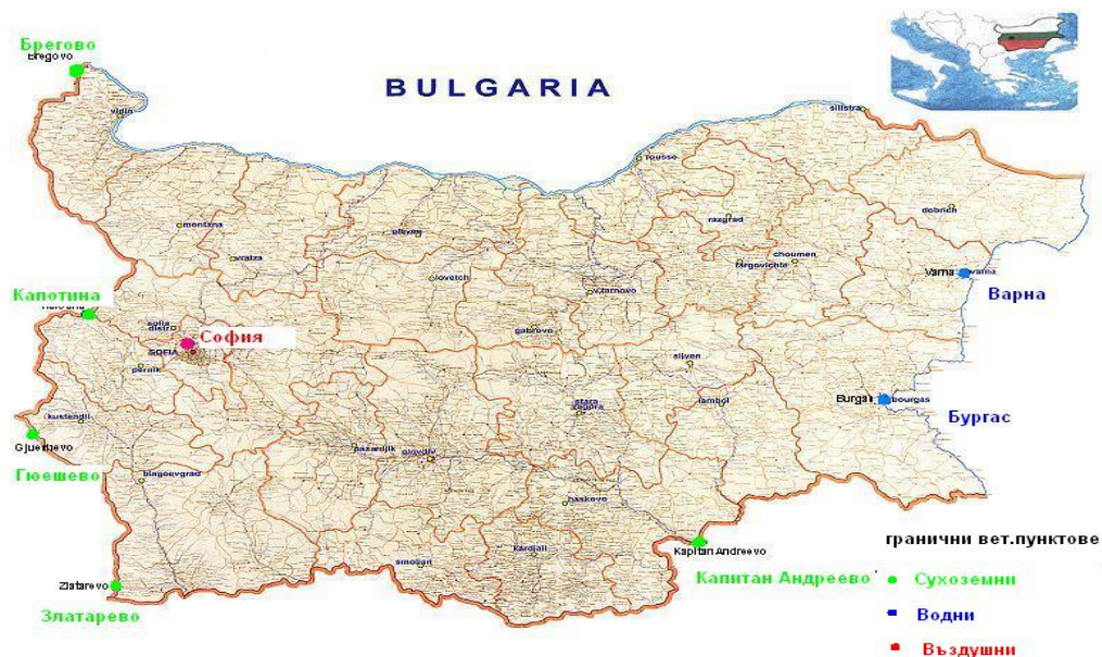
Фигура 1. Одобрени ГИП на територията на РБългария и съответни обекти на контрол.