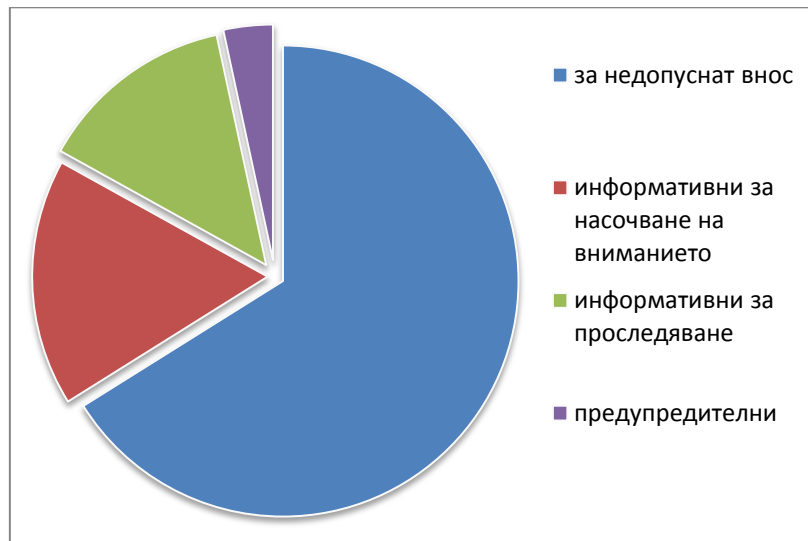
Фиг. 2. Разпределение на нотификациите за неразрешени ГМО за 2012г. по вид на нотификацията (виж Приложение 1)

първоначално многобройни нотификации за наличие на неоторизиран ГМ ориз има през 2006г. Във връзка с това Европейската комисия приема Решение 2008/289/ЕС за спешни мерки по отношение на ГМ ориз Vt63.